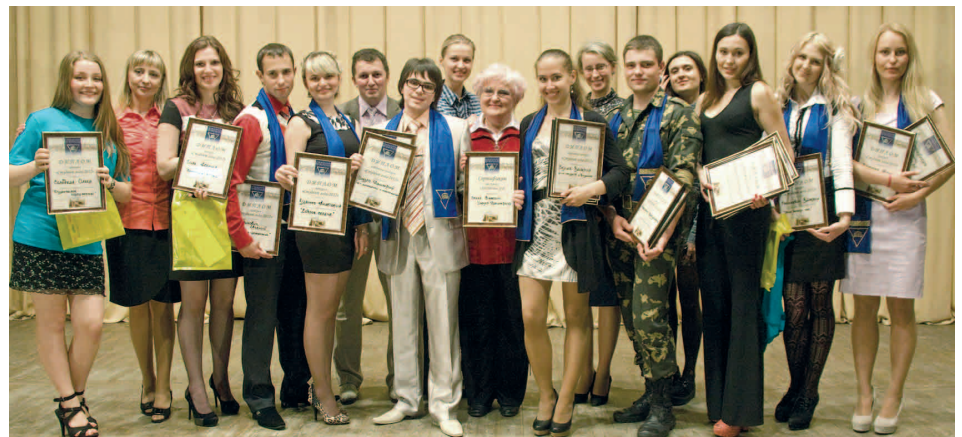
Участники конкурса «Студент года-2012» и сотрудники управления воспитательной работы с молодежью

ко дней войдет в историю, хочется в первую очередь поблагодарить своих коллег и всех сотрудников вуза за их слаженный и плодотворный труд, особую признательность выразить студенческому активу за инициативу, стремление к успеху, любовь к своей alma mater.