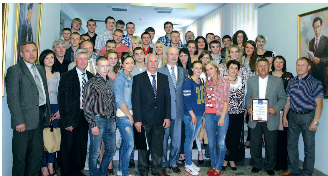
Встреча руководства ГрГУ с лучшими спортсменами и их тренерами