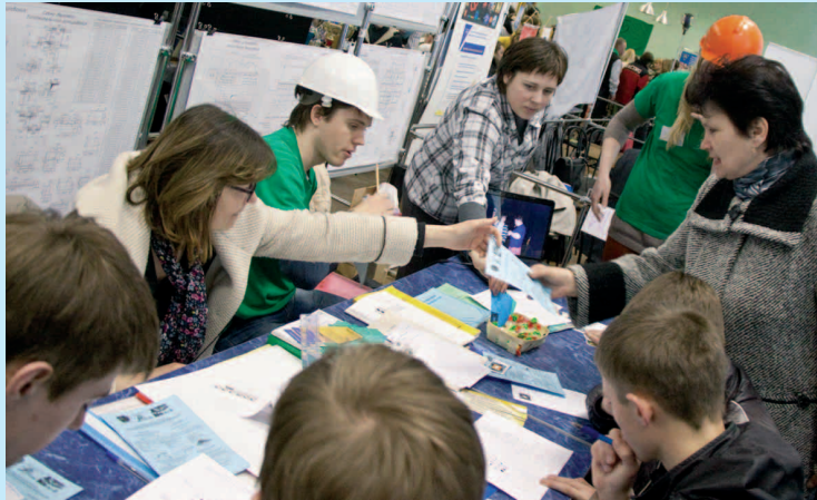
Творческая площадка инженерно-строительного факультета

В этот день Гродненский университет презентировал все факультеты, Региональный центр тестирования и довузовской подготовки, Лидский колледж. Абитуриенты, их родители и педагоги посетили творческие площадки факультетов, ознакомились с условиями приема, обучения и распределения