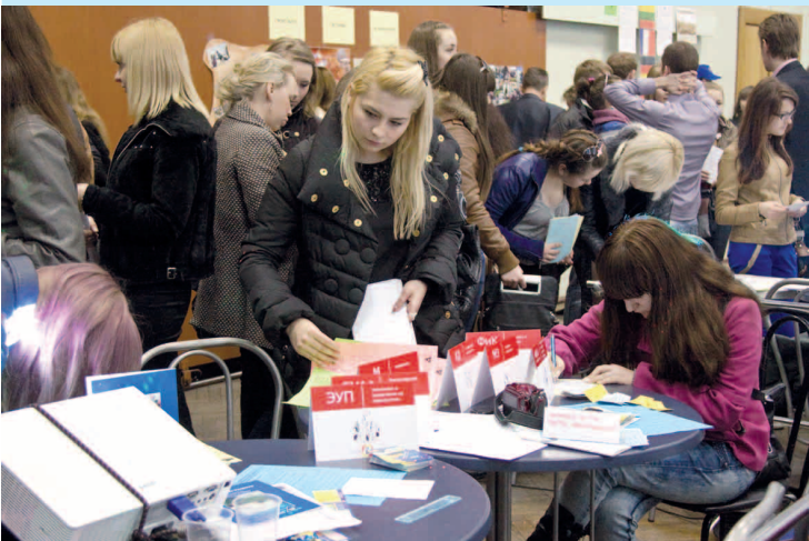
Абитуриенты знакомятся с предложениями факультета экономики и управления